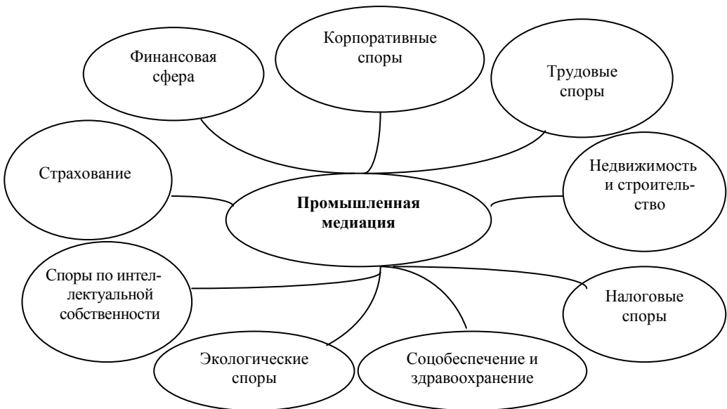
Рис. 2. Сферы применения промышленной медиации

Диапазон применения промышленной медиации представляется достаточно широким и включает в себя не только правовую сферу, но и экономическую, социальную и экологическую составляющие функционирования промышленного предприятия. Сферы применения промышленной медиации весьма разнообразны и отражены на рис. 2 [4].