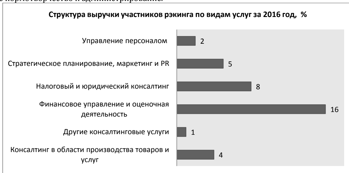
Рис. 3. Структура выручки участников рейтинга по видам услуг за 2016 год

В 2013 году на долю налогового и юридического консалтинга приходилось 19 процентов выручки[10]. В 2016 году этот показатель снизился до 8 процентов (рис. 3). Таким образом, можно предположить, что на налоговый консалтинг существенное влияние оказывают налоговое нормотворчество и администрирование.