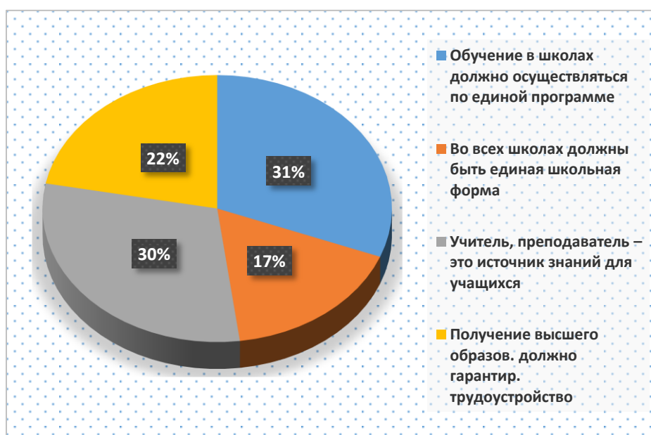
Рис. 2. Распределение ответов на вопрос: «Выскажите свое отношение к представленным суждениям о сфере образования», по возрасту (18-39 лет)

Автономность и самостоятельность как интегральные качества современного молодого человека проявляются в установках опрошенных молодых людей по поводу инструментов и способов карьерного роста. По мнению молодежи Ростовской области карьера в большей степени зависит от профессиональных качеств, высокой работоспособности и инициативности самого работника, а протекция родственников влияет на карьерный рост в меньшей степени (табл. 1).