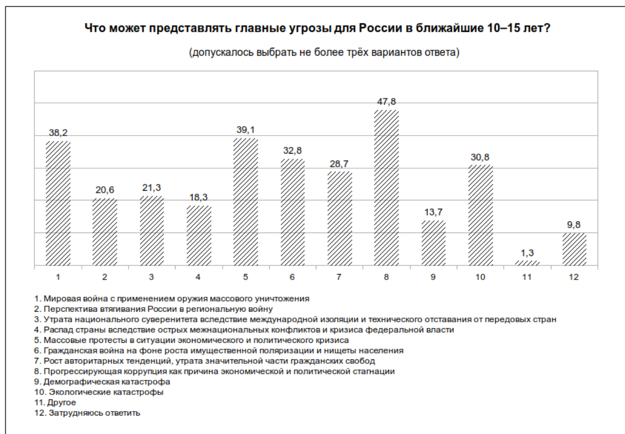
Рис. 2. Репрезентация основных угроз в сознании студенческой молодёжи Ростовской области

Наконец, в глобальном и международном аспекте в числе самых главных проблем респонденты отметили три: угрозу новой мировой войны (28,3 %), экологические катастрофы из-за изменения климата (27,3 %), а также международную изоляцию России и прогрессирующие санкции (22,8 %). Примечательно, что проблема уменьшения роли русского языка и русской культуры в мире, несмотря на активную пропаганду, практически не волнует наших студентов (2,8 %, что меньше статистической погрешности). В то время как в 2015 г. опрос показал вовлечённость студентов