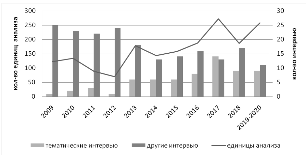
Рис. 1. Частота материалов, посвящённых военному образованию, в эфирах передачи «Военный совет» с 2009 по 2020 гг.

Внимание к проблемам военного образования в эфирах «Военного совета», как видно из рис. 1, возрастает с 2013 года, совпадая с завершением военной реформы А.Э. Сердюкова и назначением на должность министра обороны С.К. Шойгу.