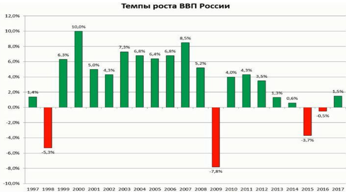
Рис. 1. Темпы роста ВВП РФ в период с 1997 по 2017 годы 1

На рис. 1 видно, что в период, начиная с 2014 г., темпы ВВП стали отрицательными и с 2017 г. имеют незначительный рост на уровне статистической ошибки.