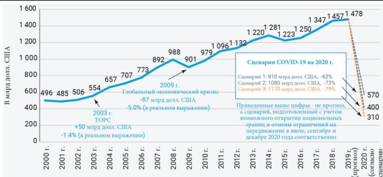
Рис. 2. Динамика поступлений от международного лечебно-оздоровительного туризма 1

В конце марта 2020 г. вследствие самоизоляции во Франции были закрыты приблизительно 80 000 ресторанов и 40 000 кафе, приблизительно 40 % из которых были ответственны за питание туристов, находящихся в лечебно-оздоровительных поездках. Этот процесс затронул приблизительно 1 млн сотрудников, которые были отнесены к категории технических безработных.