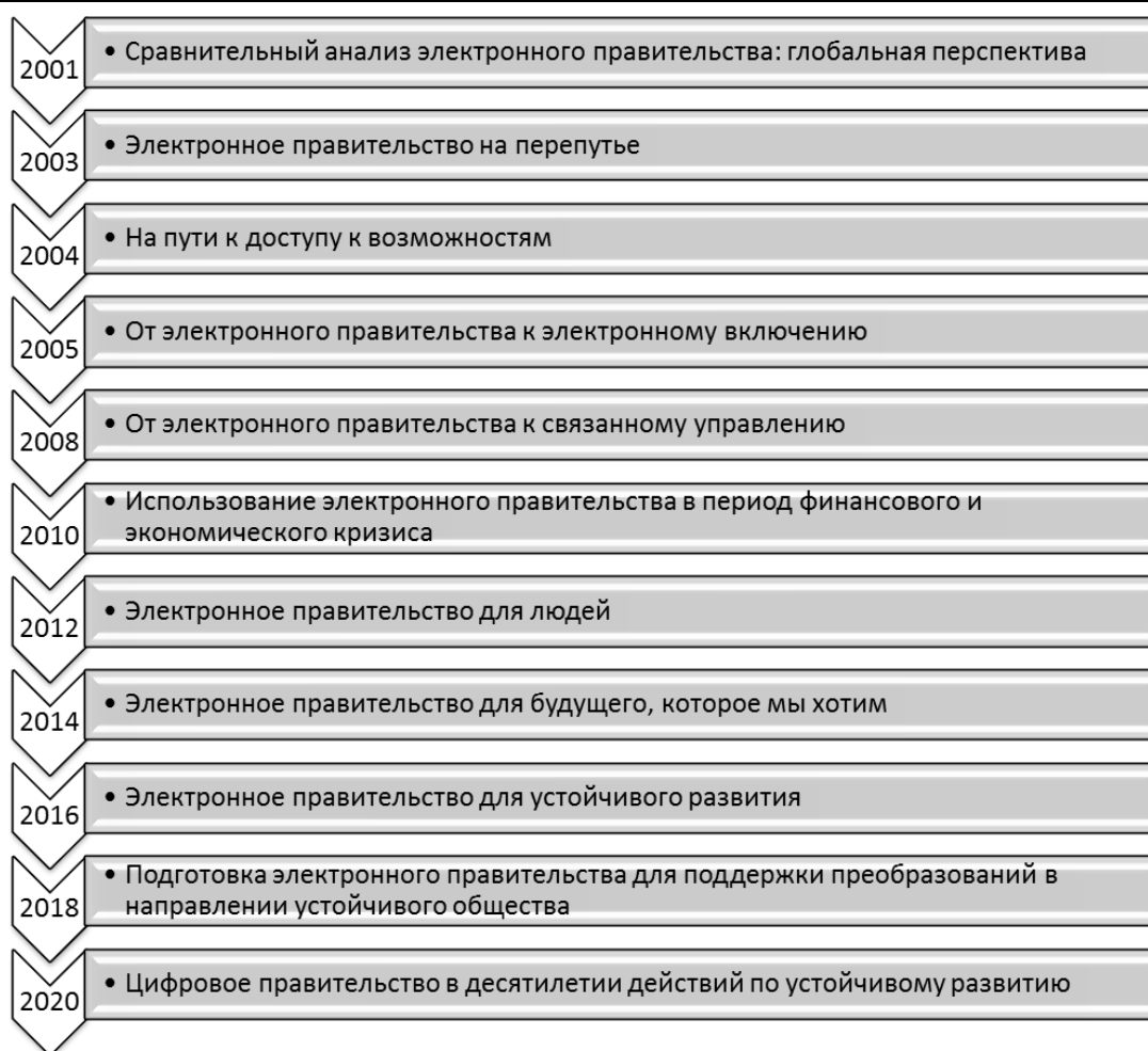
Рис. 3. Изменение фокуса отчетов о развитии электронного правительства 1

В данном контексте можно говорить о движении к новой модели зрелости электронного правительства. Например, Jin Sangki связывает развитие электронного правительства не только с технологическим прогрессом, но и с социальным переходом к умному обществу (англ. smart society), которое отличается от информационного общества более эффективными, производительными и экономичными социальными системами и процессами, которые обеспечиваются интеллектуальными технологиями, а также высоким уважением человеческого достоинства и созданием ценностей путем объединения технологий и других секторов [6]. Ученый считает, что на более высоком уровне развития цифровое правительство, базирующееся на Web 3.0, в интеллектуальном обществе будет предоставлять интерактивные услуги на основе социальных сетей и поддерживать персонализированные и настраиваемые услуги, а не услуги, ориентированные на поставщиков, и превентивные схемы, а не временные или пост-событийные меры. Электронное правительство в умном обществе должно играть новую роль как открытая площадка для сбора разнообразных знаний и мудрости для решения социальных проблем и создания новых ценностей [6].