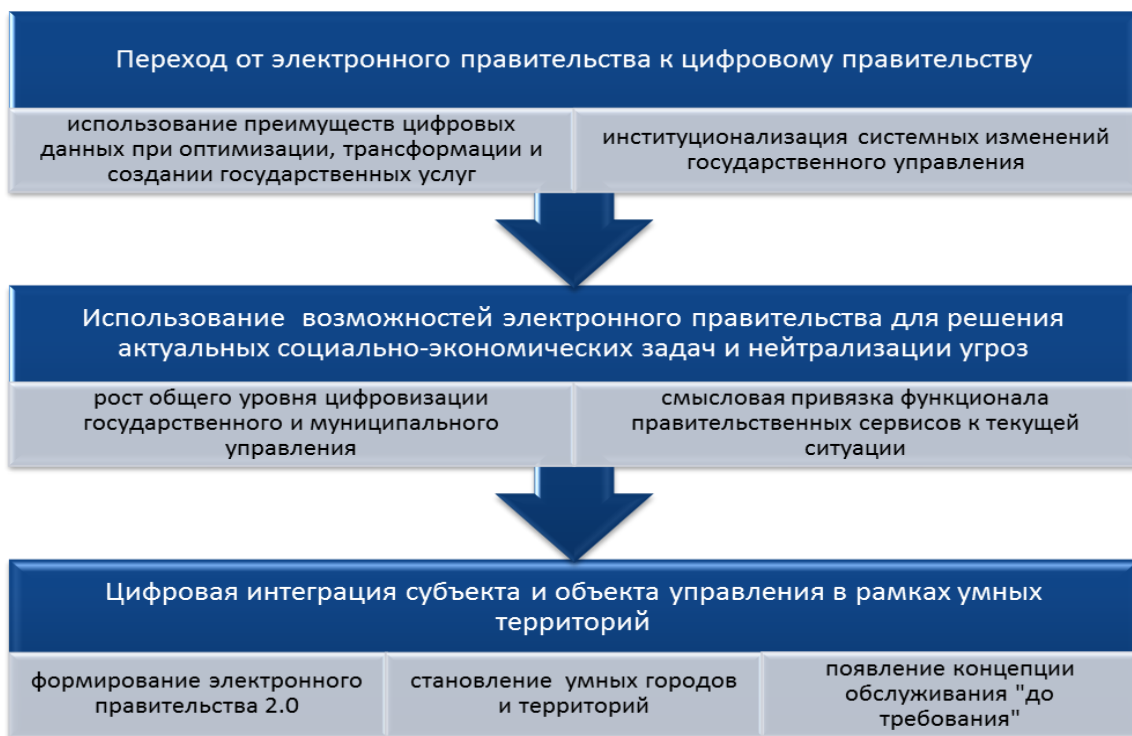
Рис. 1. Тенденции развития электронного правительства

Проведенный в ходе исследования анализ становления и развития электронного правительства в глобальном контексте позволил выделить несколько тенденций, которые фактически определяют перспективу трансформации государственного управления в цифровой экономике (рис. 1).