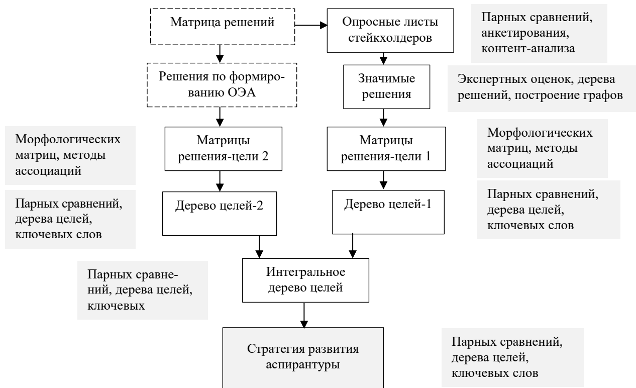
Рис. 2. Распределение методов перехода от решений к стратегии Fig. 2. Distribution of methods for moving from decisions to strategy

На рис. 2 отмечены основные инструменты, позволяющие обработать результаты опросов стейкхолдеров (формирование опросных листов, метод парных сравнений и контент-анализа) и выделить наиболее значимые решения (методы экспертных оценок, построения дерева решений и построения графов). Значимые решения определены методом экспертных оценок стейкхолдерами (научными руководителями, аспирантами и работниками аспирантуры) в процессе опроса, подготовленного по результатам обработки заполненных на аналитическом этапе матриц решений.