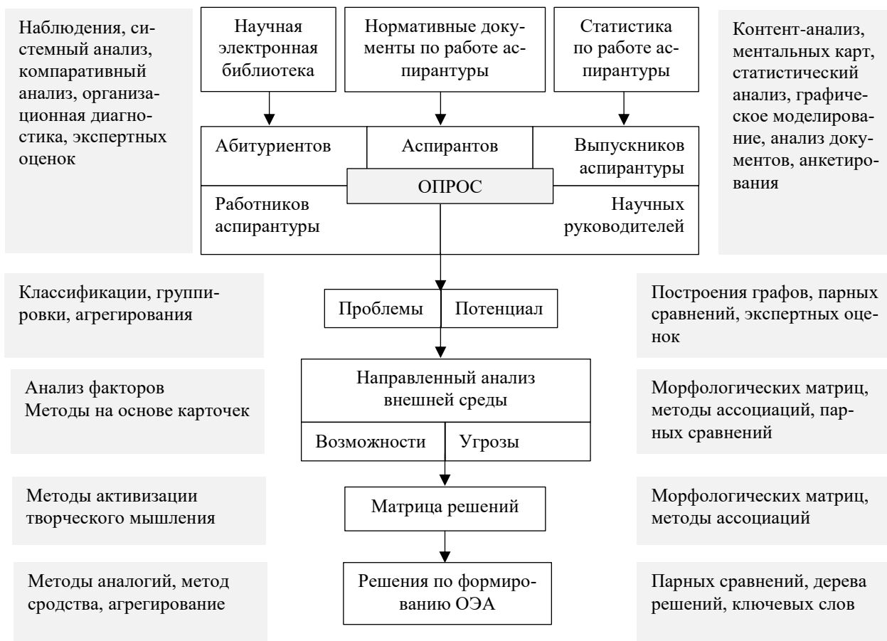
Рис. 1. Распределение методов анализа и поиска решений Fig. 1. Distribution of methods of analysis and search for solutions

Просматривается алгоритм, обеспеченный инструментами исследования, отображенный на рис. 1, в котором показан переход от результатов анализа вторичной и первичной информации, завершающийся опросом стейкхолдеров и формулированием наиболее значимых проблем и потенциала обучения в аспирантуре, с последующим выполнением направленного анализа факторов внешней среды.