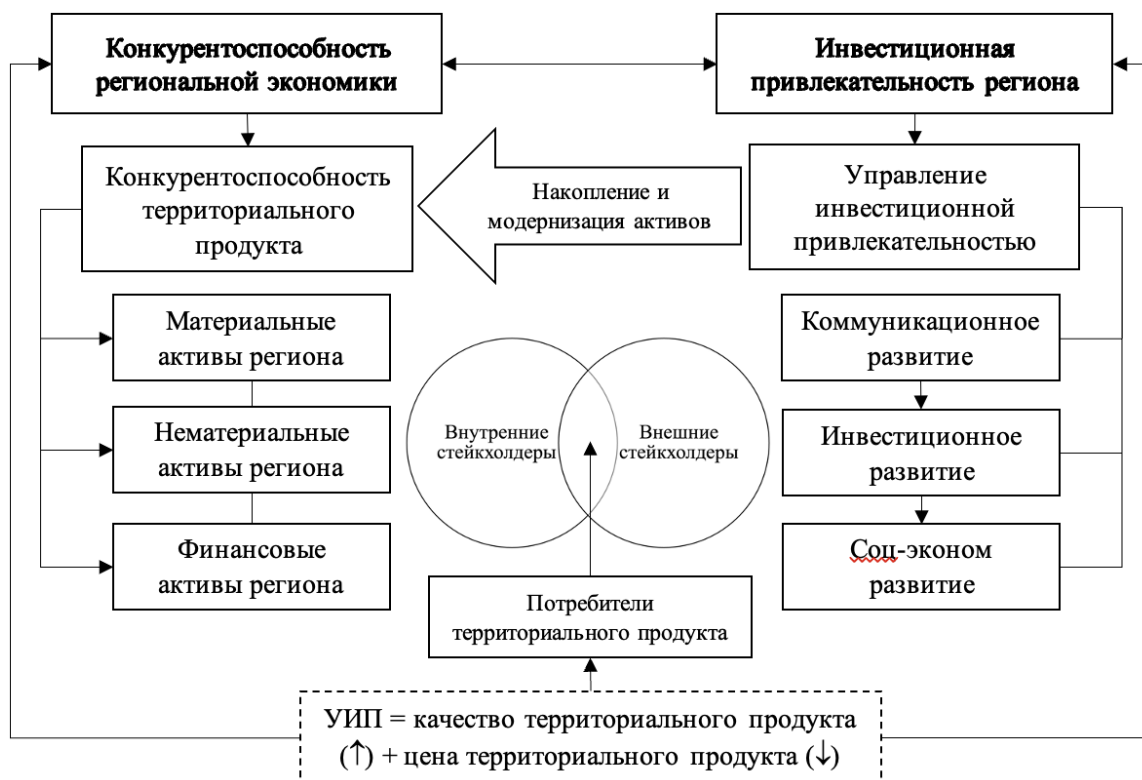
Рис. 4. Концептуальная модель системы управления конкурентоустойчивостью экономики региона как квазикорпорации Fig. 4. Conceptual model of a system for managing the competitive sustainability of the regional economy as a quasi-corporation

Таким образом, можно выделить следующие основные принципы управления конкурентоустойчивостью экономики региона как квазикорпорации с позиции системного подхода: