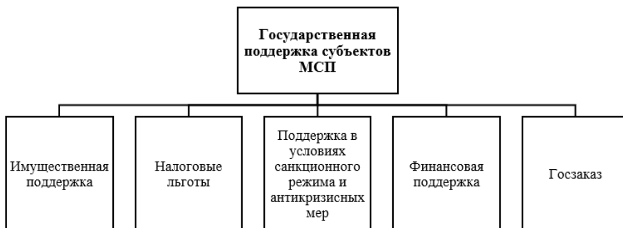
Рис. 3. Система государственной поддержки субъектов МСП 1